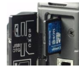
16GB SD カード