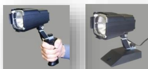
300W ミニビデオライト