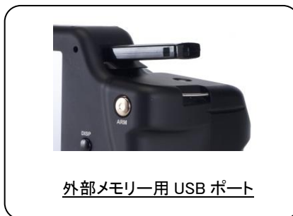
外部メモリー用 USB ポート