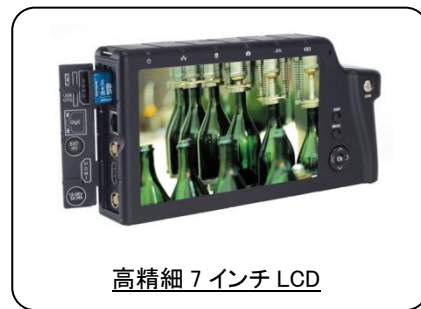
高精細 7 インチ LCD