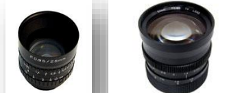
高感度 F0.95 の 25mm と 50mm レンズ