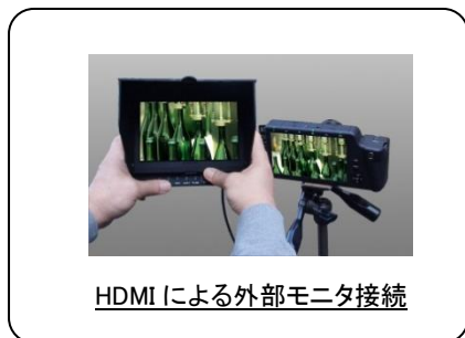
HDMI による外部モニタ接続