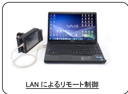
LAN によるリモート制御